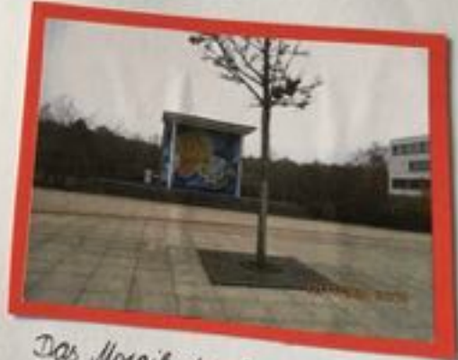
Das Mosaik der ehemaligen Schule!