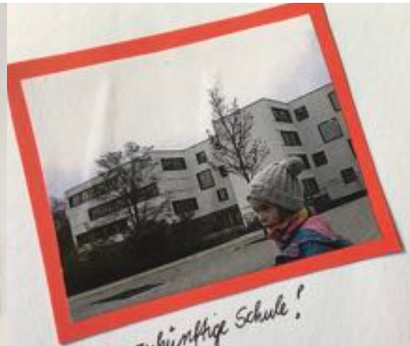
Unser zukünftige Schule!