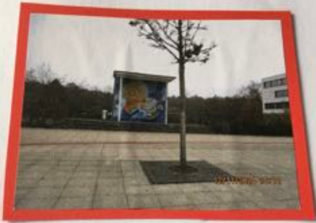
Das Mosaik der ehemaligen Schule!