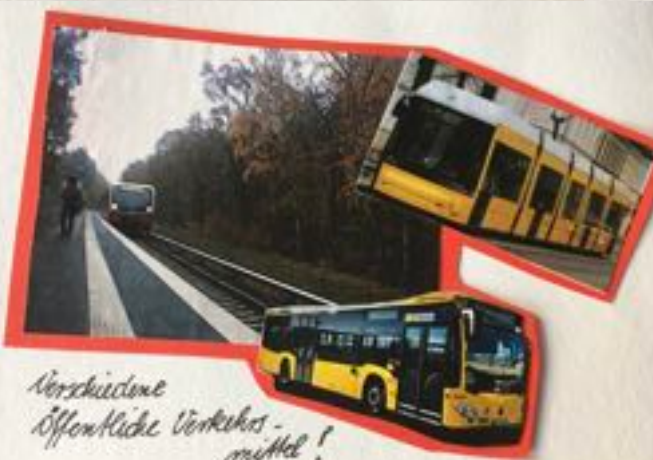
Verschiedene Öffentliche Verkehrs- mittel!