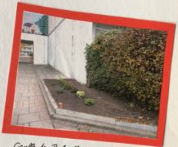
Gepflegte Rabatten und Vorgärten!