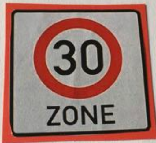
Autos müssen langsam fahren. PO