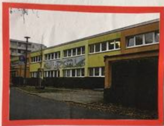
Unsere Kita; Neugestaltung der Außenanlage!