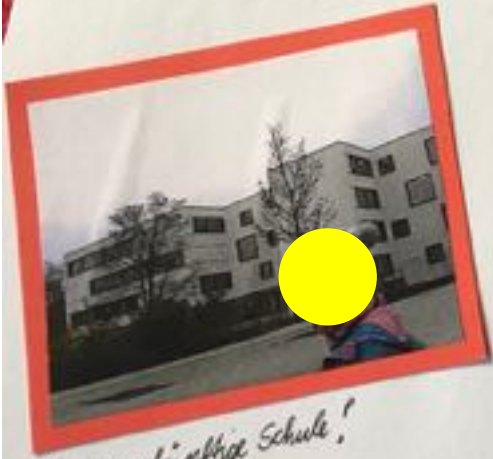
Unsere zukünftige Schule!

Was gefällt Dir besonders gut in Deinem Stadtteil / Deinem Wohngebiet?