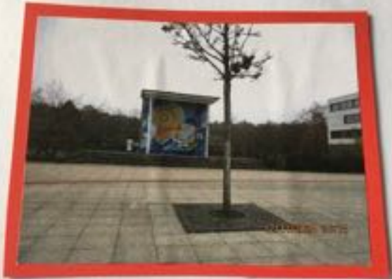
Das Mosaik der ehemaligen Schule!