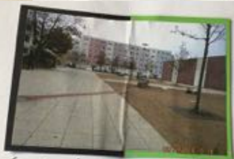
Als Spielfläche mit z. -Kippplätzen, Großraumstra