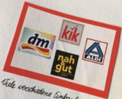
Viele verschiedene Einkaufsmöglichkeiten!