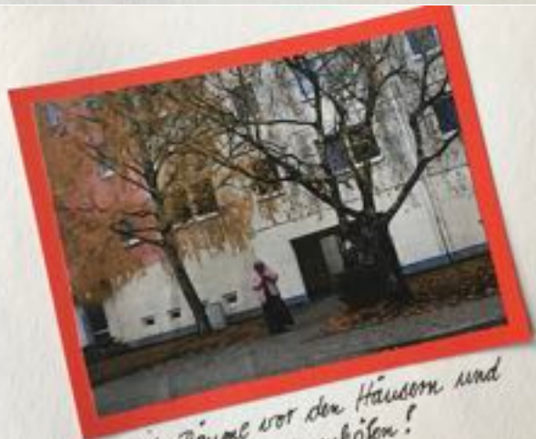
Viele Bäume vor den Häusern und in den Innenhöfen!